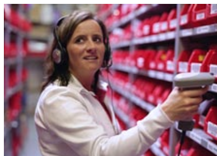
Voicesystem im Einsatz

Sprachgestützte Systeme zur Steuerung von logistischen Prozessen gelten als überaus effizient und haben in den vergangenen Jahren zunehmend an Bedeutung gewonnen. Beim so genannten „Pick-by-Voice“ werden die Mitarbeiter mit einem Head-Set, einem Voice-Client und gegebenenfalls mit einem Strichcodescanner ausgestattet. Sie erhalten akustische Anweisungen, müssen keine zusätzlichen Informationen visuell erfassen und haben die Hände frei – etwa zum Heben und Transportieren von Waren. Eingesetzt werden kann die Spracherkennung auch im Wareneingang, der Retourenabwicklung, bei Inventur, Verpackung und Versand.